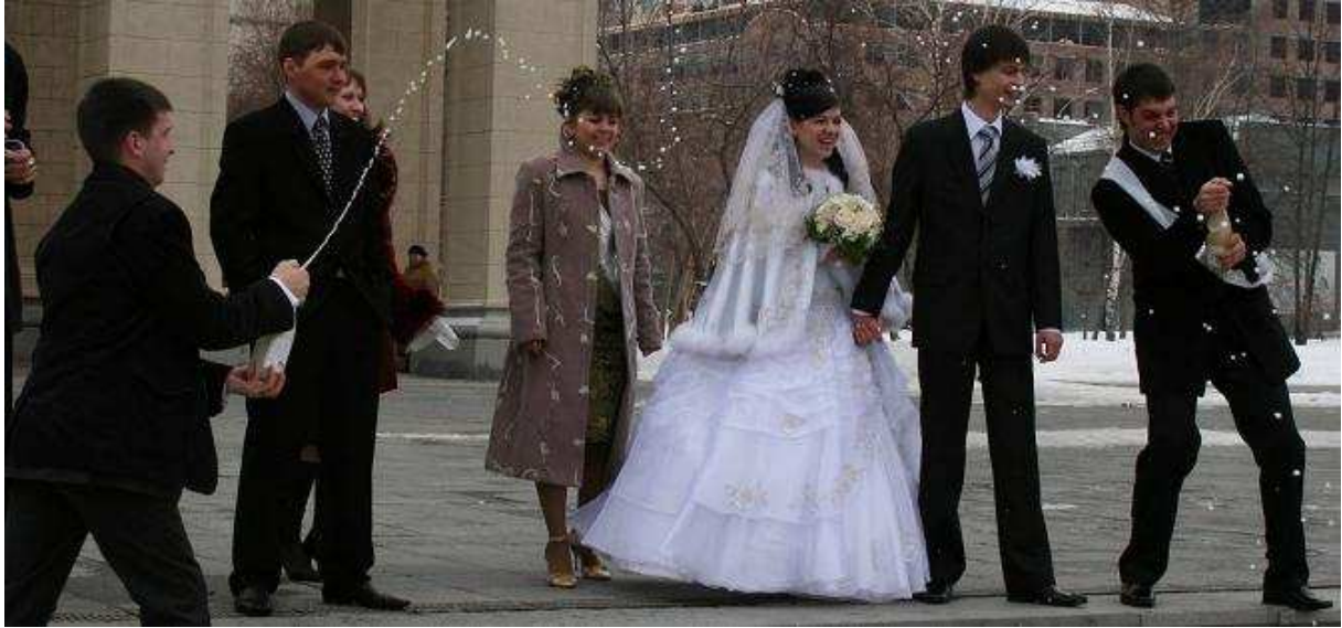
Bruiloft in Novosibirsk

Op straat is het goed oppassen. Trotoirs die schuin lopen en glad zijn door het ijs. Ondanks dat lopen ook hier bijna alle dames op laarsen met naaldhakken. Ik heb zo al moeite om overeind te blijven!