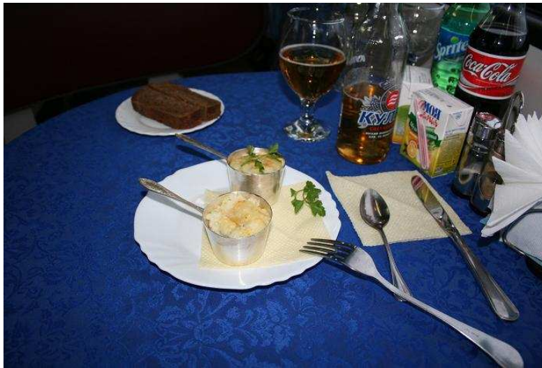
Klein menu'tje, wel lekker!

Wat ik wel weet is dat het eten goed gesmaakt heeft. Twee kleine steelpannetjes gevuld met schijfjes paddestoelen en stukjes ui, daar overheen een sausje met kaas en ei.