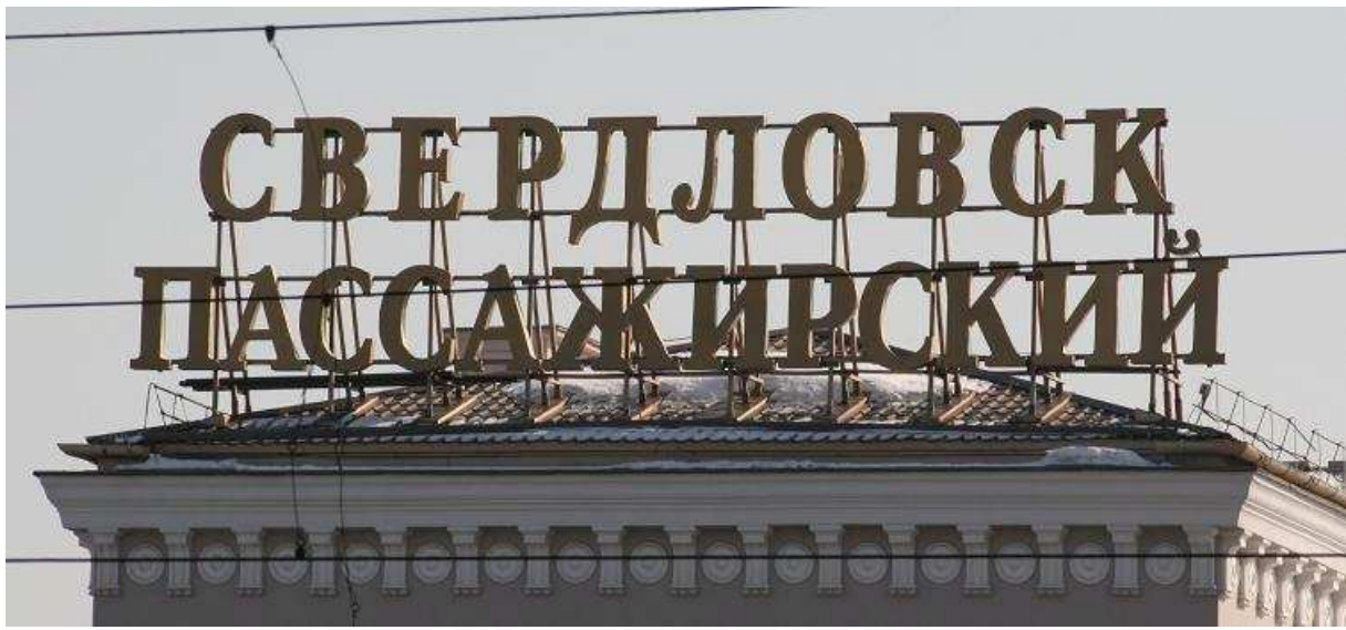
Treinstation Ekaterinaburg (Sverdlovsk)

Om 8u00 opgestaan. Kop onder de kraan en ontbijt. Als ik de waterkraan bij het kleine wasbakje open draai, komt er eerst lucht, dan roestbruin water, daarna helder water dat echter wel naar chloor stinkt.