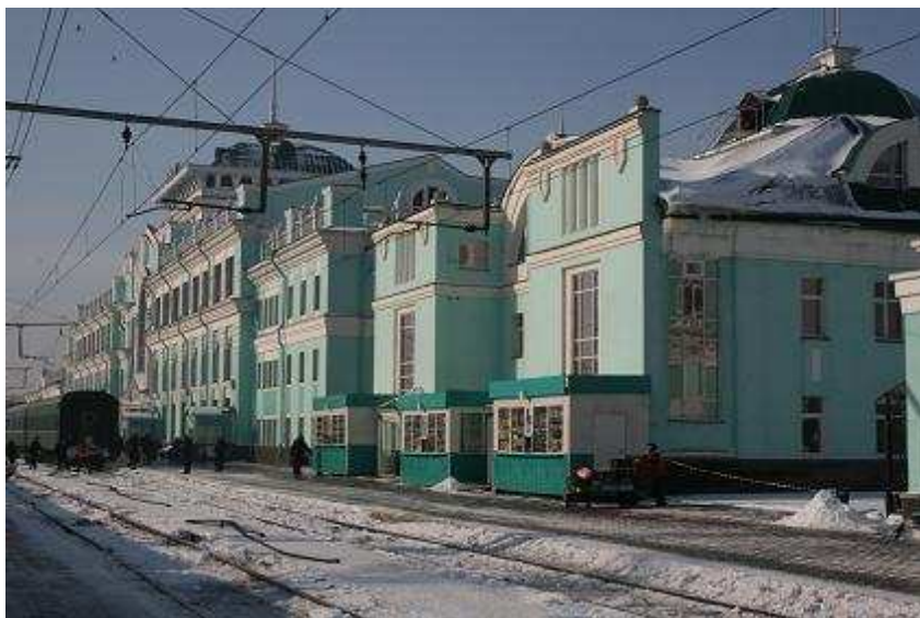
Treinstation in Omsk