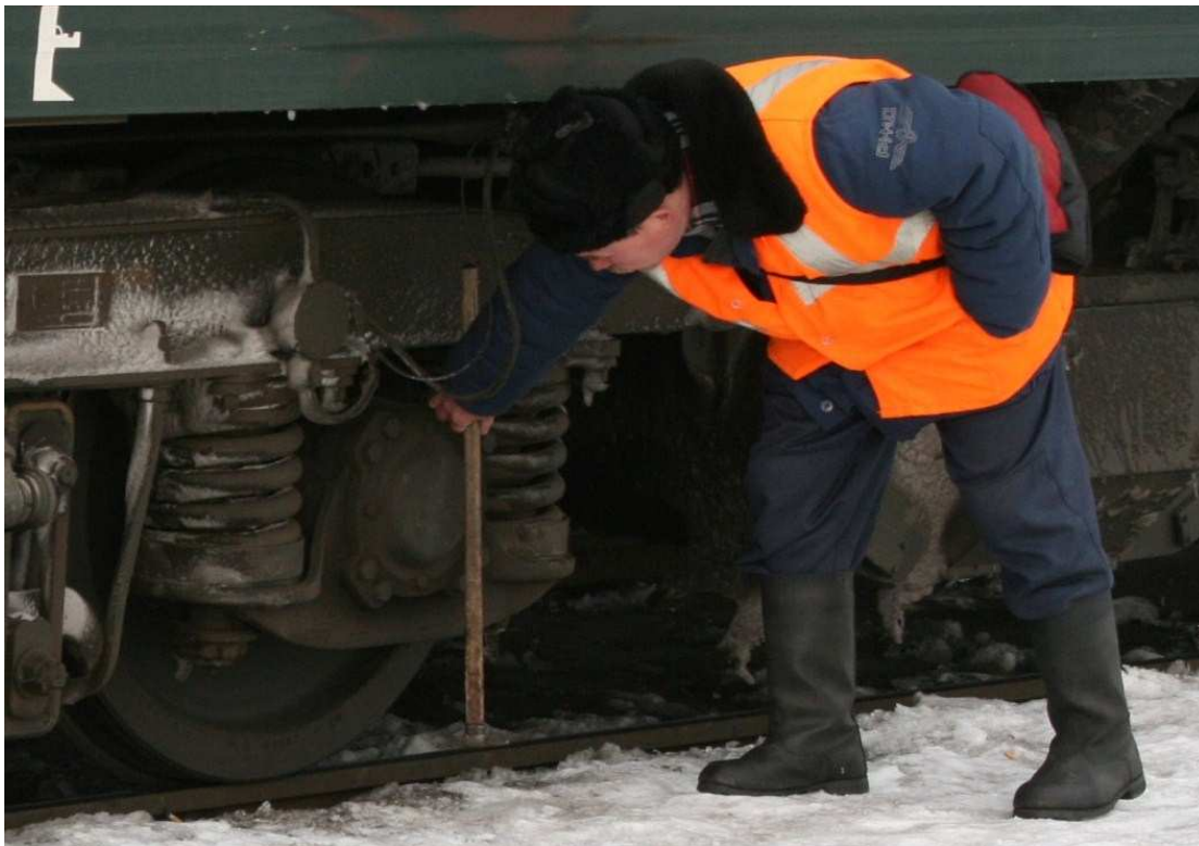
Controle van de onderstellen

We blijven hier, zo verteld zij mij, 15 minuten staan. Hier is de wereld wit buiten. Toch wel fris in m'n T-shirt, maar ik heb geen zin om naar binnen te lopen en m'n jas te halen. Ik schat een paar graden onder nul.